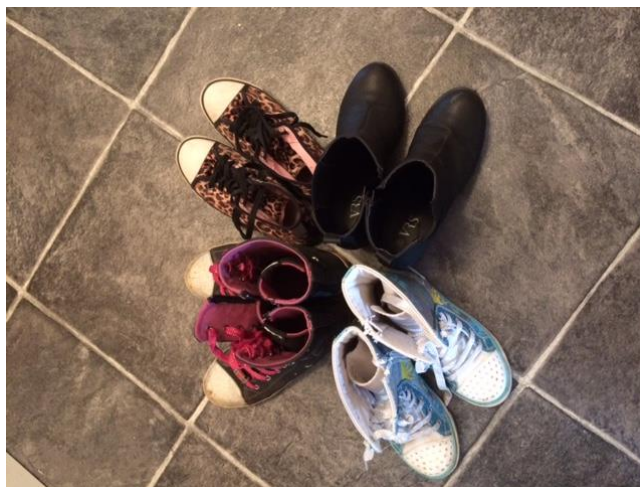
Skoene på billedet tilhører en mor, der er alene med hendes 3 piger (moren har givet tilladelse til at billedet vises)